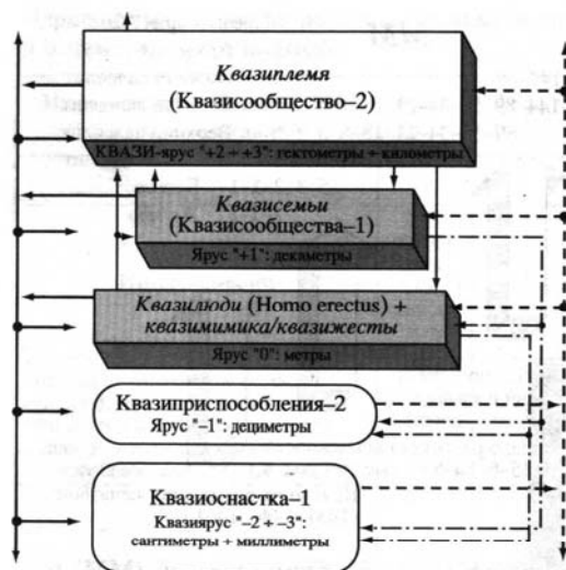
Рис. 1. Иерархическая подсистема «Человечество-2»

Лидировала с 1.86 млн. до 121 тыс. лет до н.э.