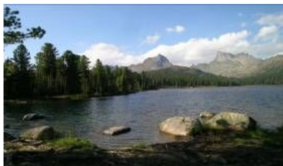
Один из водопадов и горное озеро Светлое в Западном Саяне

Привет из Сибири! Ярких Всем впечатлений в наступающем году!