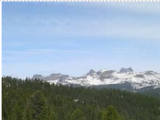
Спящий Саян без и под снежным покрывалом