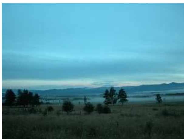
Каменный город и Танзыбейская котловина на юге Красноярского края